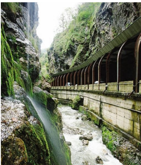
La galleria di Bracca che sarà prolungata