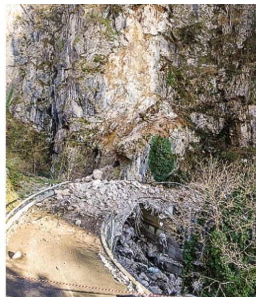
La frana caduta il 2 dicembre 2013 a Rosolo